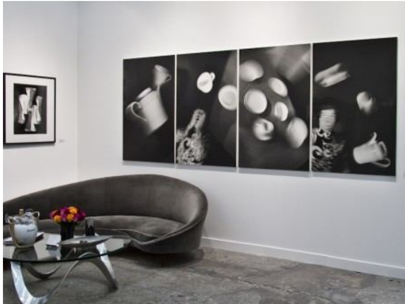
Anna und Bernhard "Tellerraum", (r.), Otto Steinert "Kommutierende Formen" (l.), Galerie Kicken

Was sagt der Franzose in ihm? Les femmes qui prennent des photos. Ils existent