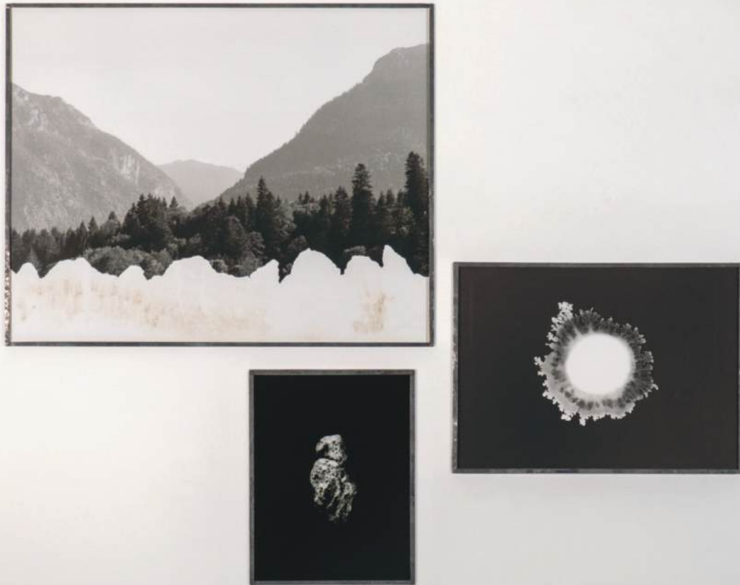
Entropie. 12024. Deux tirages argentiques, un photogramme, plomb oxydé two gelatin-silver prints, one photogram, oxidised lead. 81,5 x 103,5 cm

Les premières associent des images, plus rarement des images et des objets, de même nature. Organisés en séquences ou superposés sur une même feuille, les « blobs » de la série Émergence (12022-23 [2]) rendent compte de leur croissance; disposées en arbre, les « Vénus » devenues des Matriarches (12022) créent une potentielle généalogie féminine; la grande installation ( Matrice fossile , 12025) présentée au Transfo joue du contraste entre le néon hors d'usage et son empreinte paradoxalement lumineuse. Les secondes confrontent des éléments de natures différentes: les photogrammes de néons et les morceaux d'asphalte dans les équilibres précaires des Lithopanspermie (12022-25); les « Vénus » et les néons de la série Émergence matriarcale (12023-24); enfin, un paysage empreint d'asphalte, une « Vénus » et un « blob » dans la composition Entropie (12024).