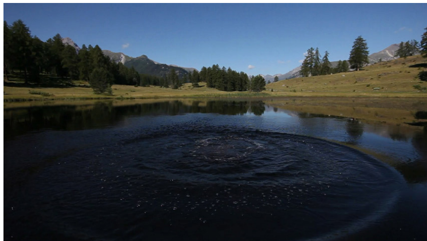
The Lake , video HD, 2'10 loop, 2013