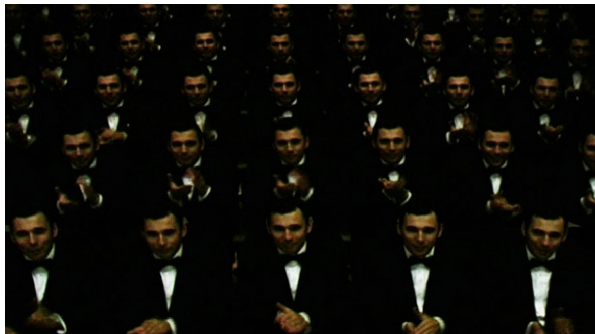
Corpus / Clapping , video SD, 1'35 loop, 2008