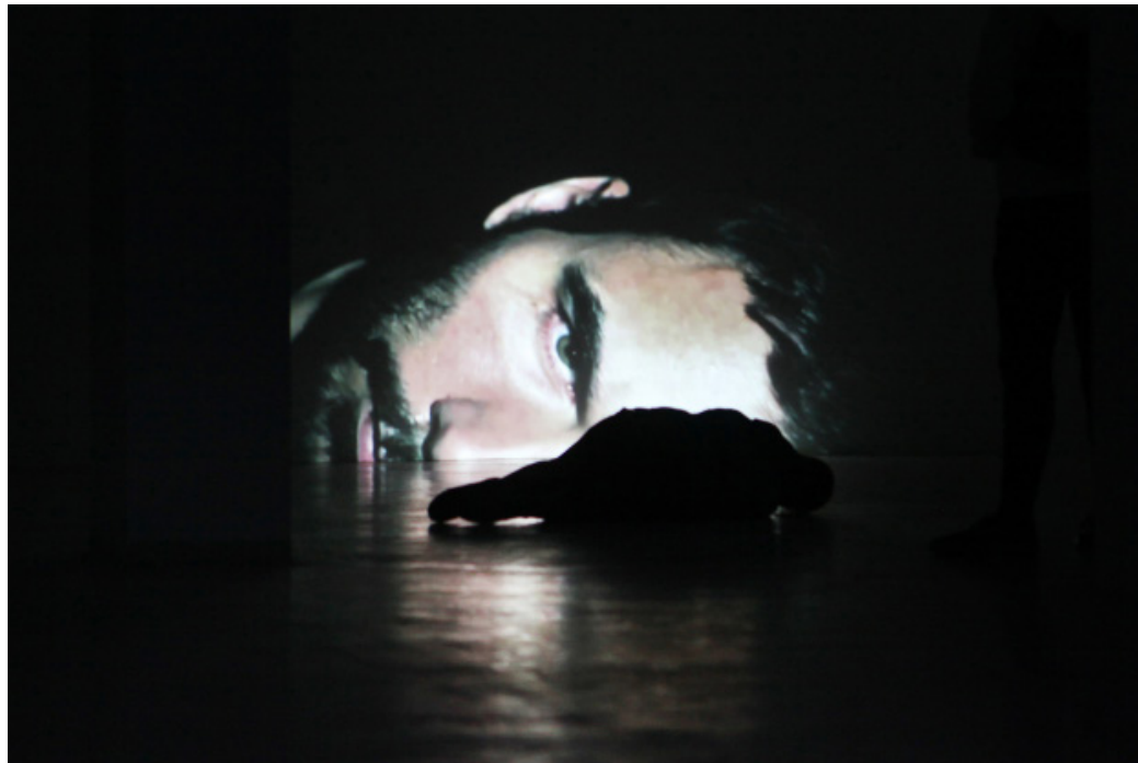
Facing , video HD, 3', couleur, son, 2013