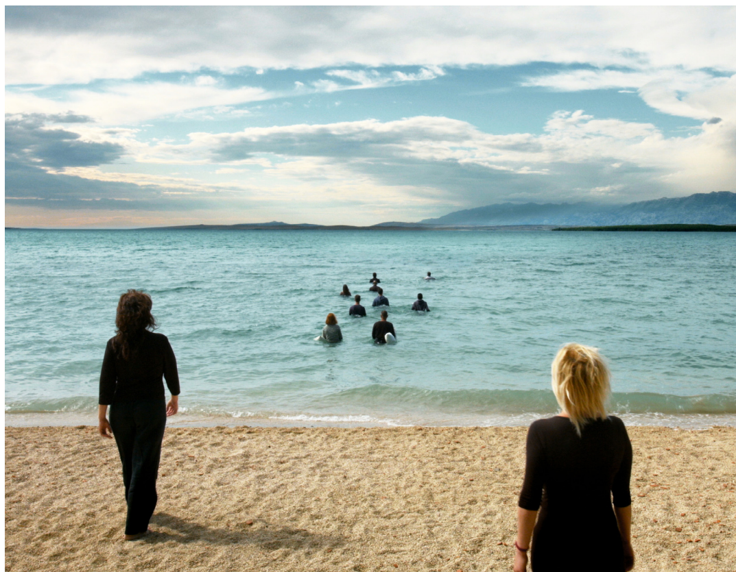
On the Beach , video HD, 24', couleur, son, 2016

La Galerie Dix9 a le plaisir de vous présenter