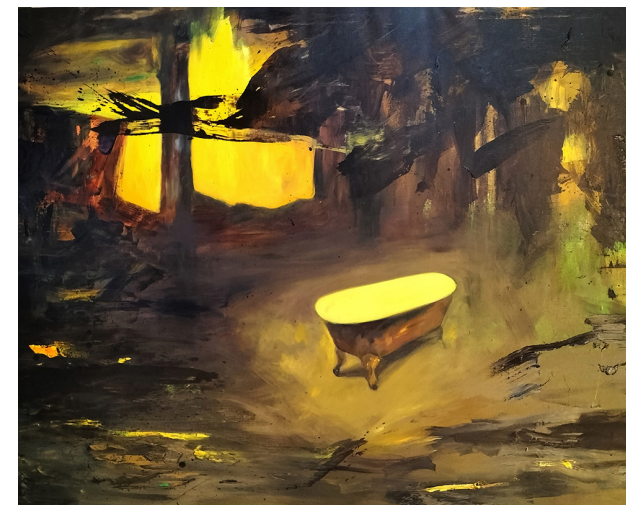
De nouveaux jours brilliaient, huile sur toile, 160x130 cm, 2022