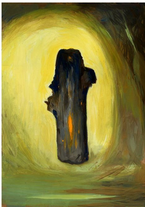
Remains , huile sur papier, 48x36 cm, 2022