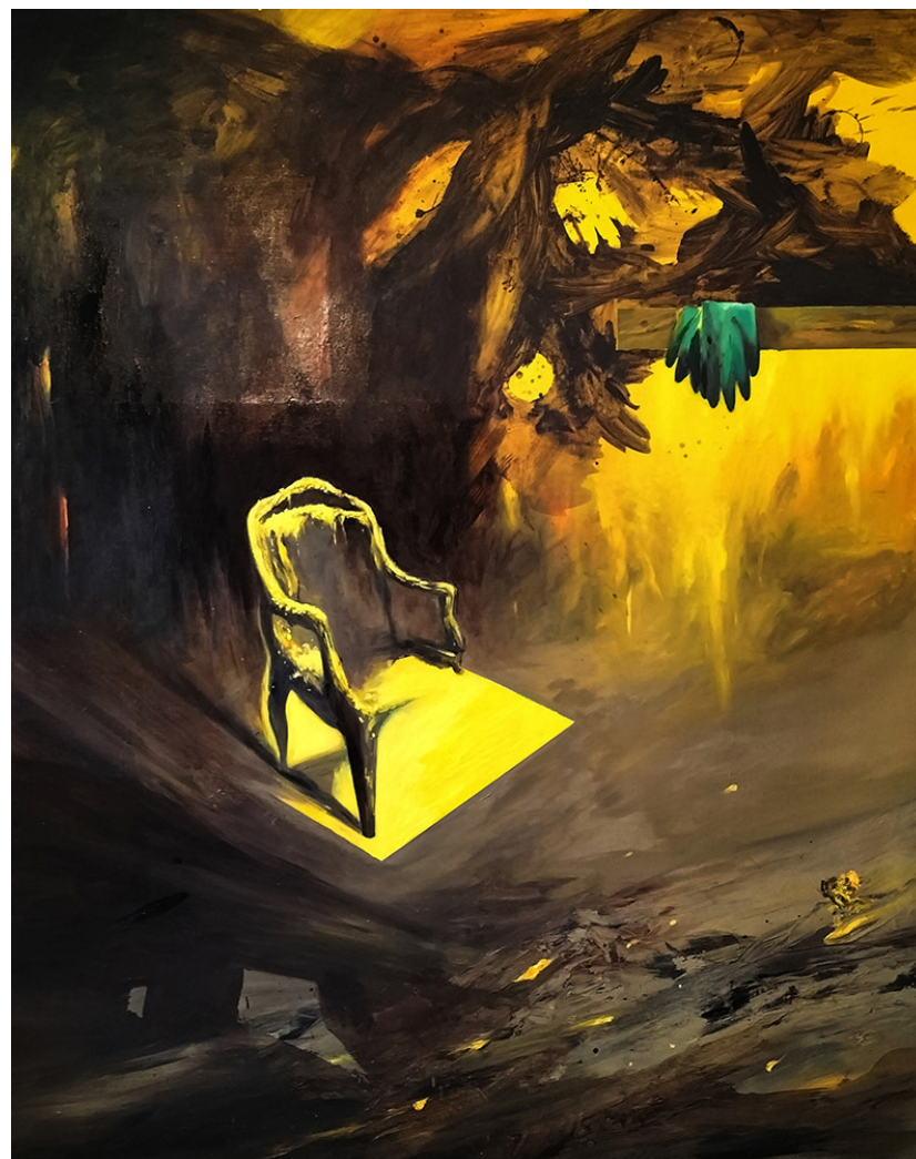
Avait pris les étoiles huile sur toile, 200x160 cm, 2023