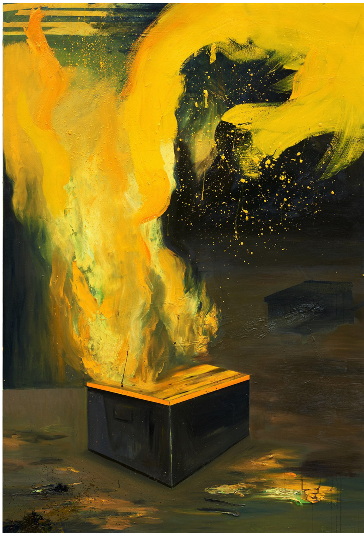
Le douzième jour , huile sur toile, 195x130 cm, 2022

La Galerie Dix9 a le plaisir de vous présenter