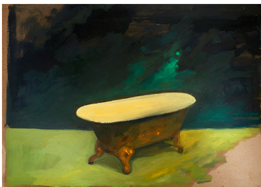
Small Apocalypse huile sur papier, 48x36 cm, 2022