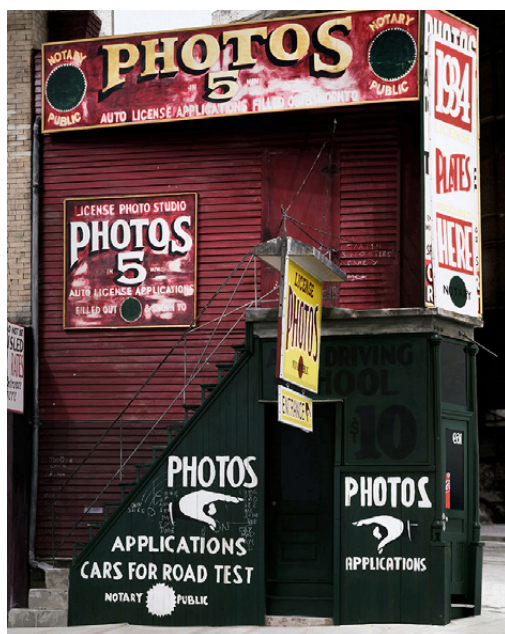
Camille Fallet, Color Photo Studio tirage pigmentaire, 44x50 cm, 2018