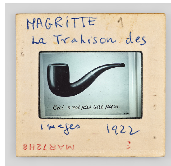
Sebastian Riemer, Magritte La Trahison des images tirage pigmentaire, 90x90 cm, 2021