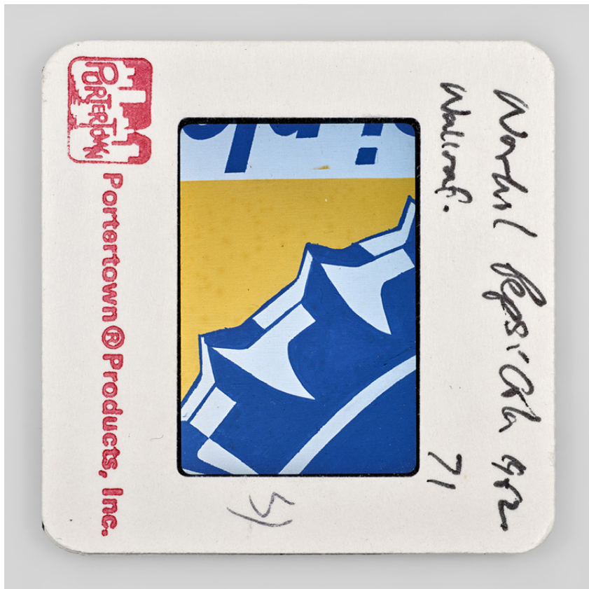
Sebastian Riemer, Warhol Pepsi Cola 1962 Wallraf , série Stills impression pigmentaire, 90x90 cm, 2021

La Galerie Dix9 a le plaisir de vous présenter