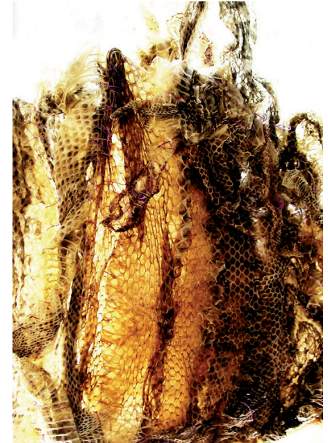
Impossible bag (détail) , 2011 mues de reptile, fil - 20 x 30 cm