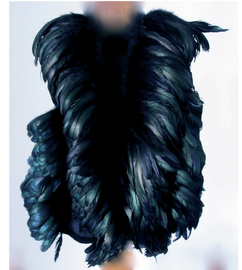
Impossible waistcoat , 2011 plumes, tissu, fil de soie - 55x35 cm