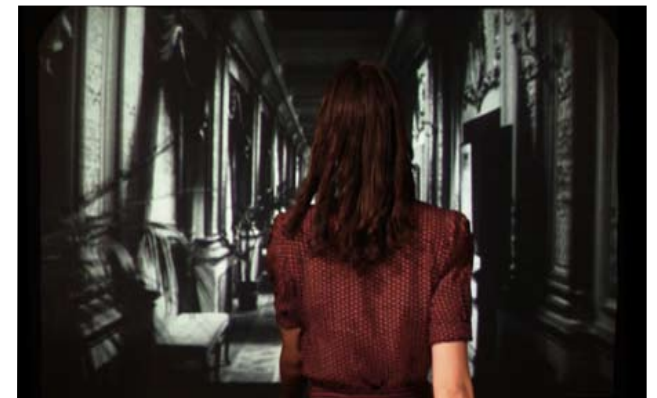
Antichthonos 1, 2012

vidéo HD, couleur et noir & blanc, boucle, muet