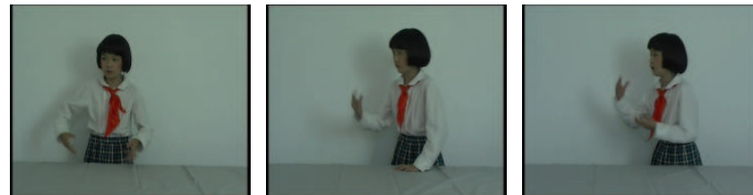
Sanjie installation vidéo, 2003