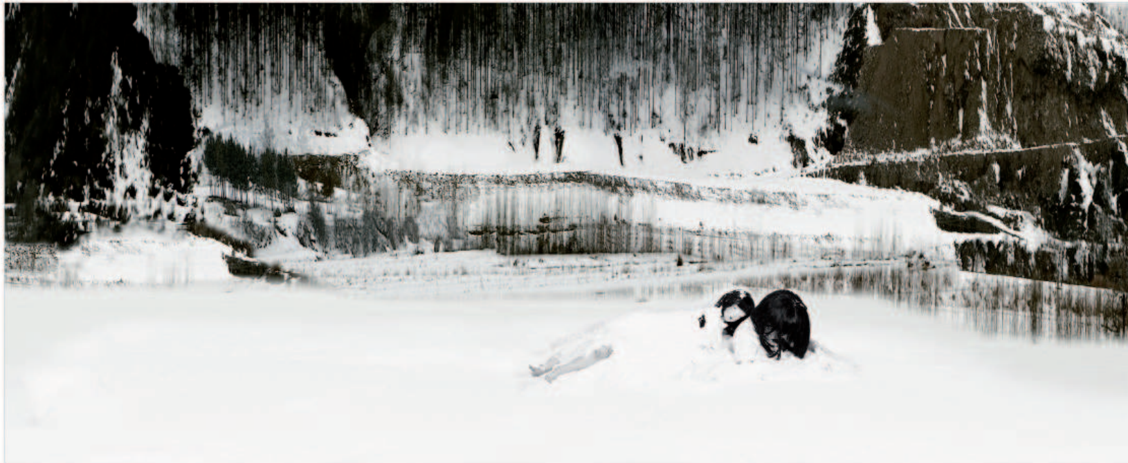
Existential Emptiness 5 130 x 57 cm, 2009