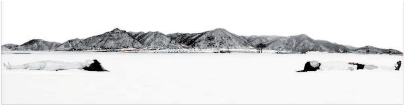
Existential Emptiness 1 243 x 67,5 cm, 2009