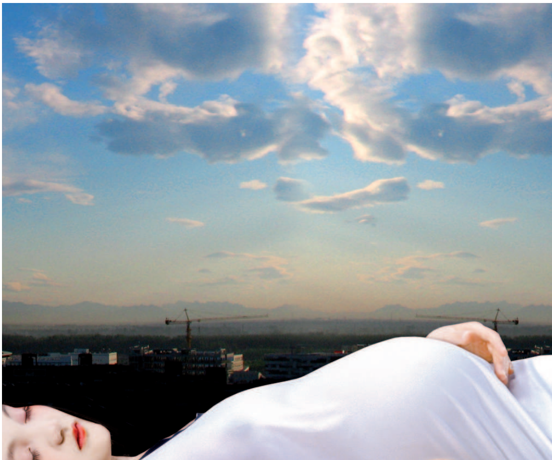
Angel No 13 80 x 66.67cm, 2006

La Galerie Dix9 a le plaisir de vous présenter