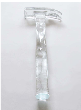
Anne Deguelle Objet de Mélancolie , 2015 cristal 30x11x2cm