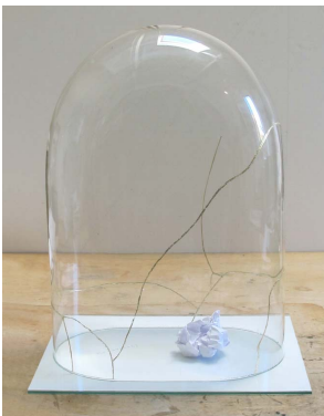
Anne Deguelle Le Monde Kintsugi , 2015 verre, or, papier 50x42x30cm