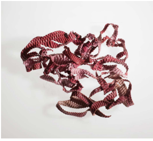
Sheila Concari Pink Medusa peaux de python, fil en soie, résine dimensions variables