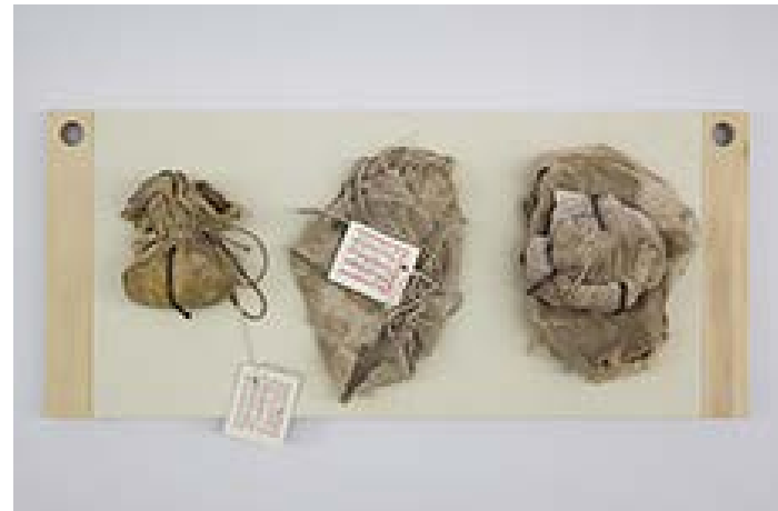
Archeological matter , terre cuite, coton, lin, carton, 46x20cm