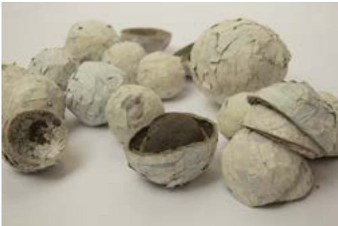
Cascaras papier (journal de l'artiste), peinture, lin, 2015