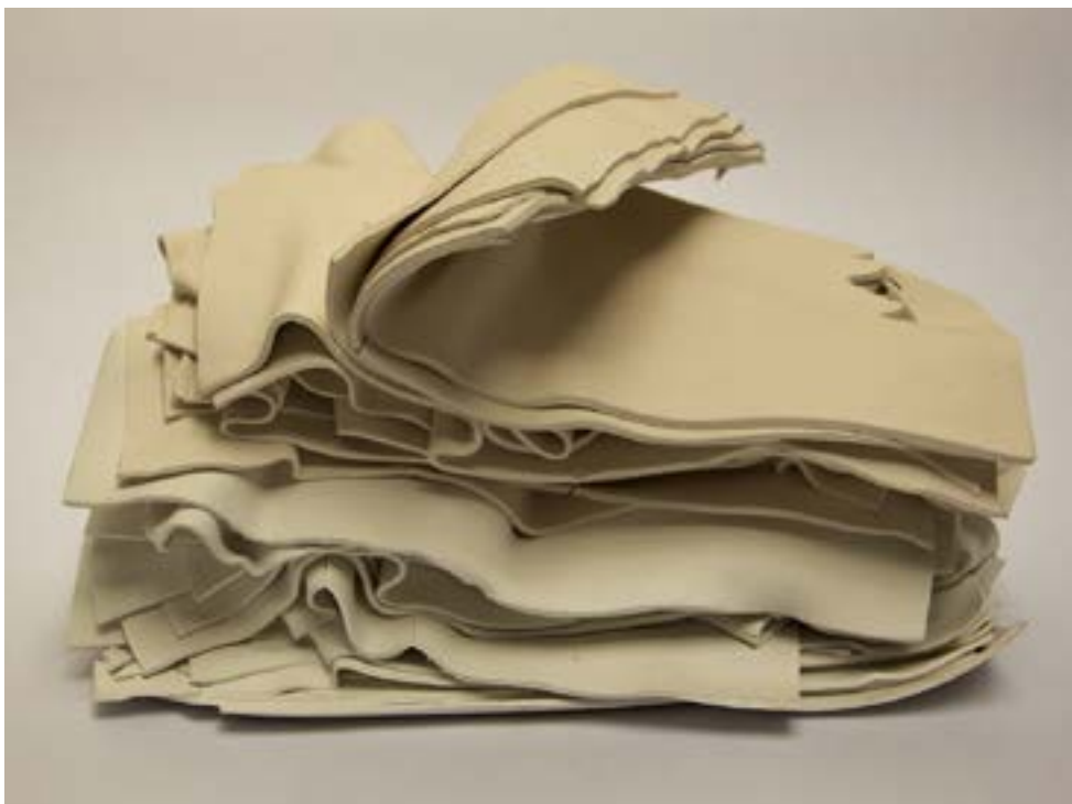
Livre Blanc , 2014 terre cuite, 35 x 26 x 16 cm

La Galerie Dix9 a le plaisir de vous présenter