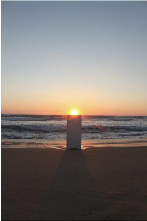
Endless Show, 2013 impression Lambda contrecollée sur aluminium, 120 x 80cm + cadre chêne massif