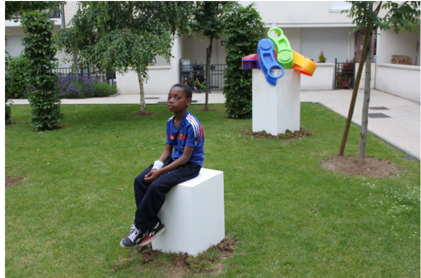
Together, 2013 Socles en médium, peinture acrylique, objets du quotidien. Dimensions variables Vue de l'exposition, Cité de l'Avenir, Paris