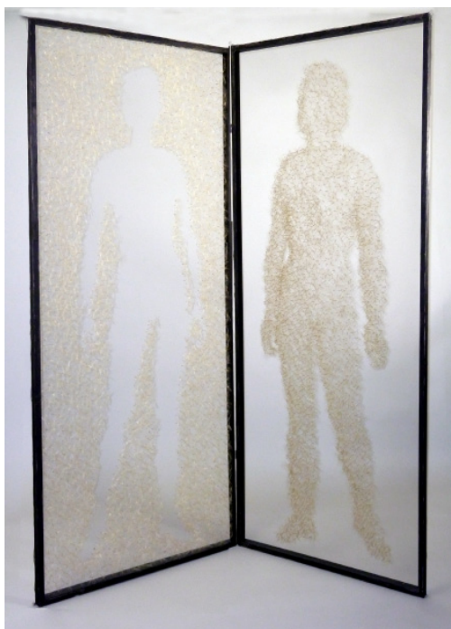
Le départ 1,51 x 1,80m - akènes de pissenlit, plexiglas