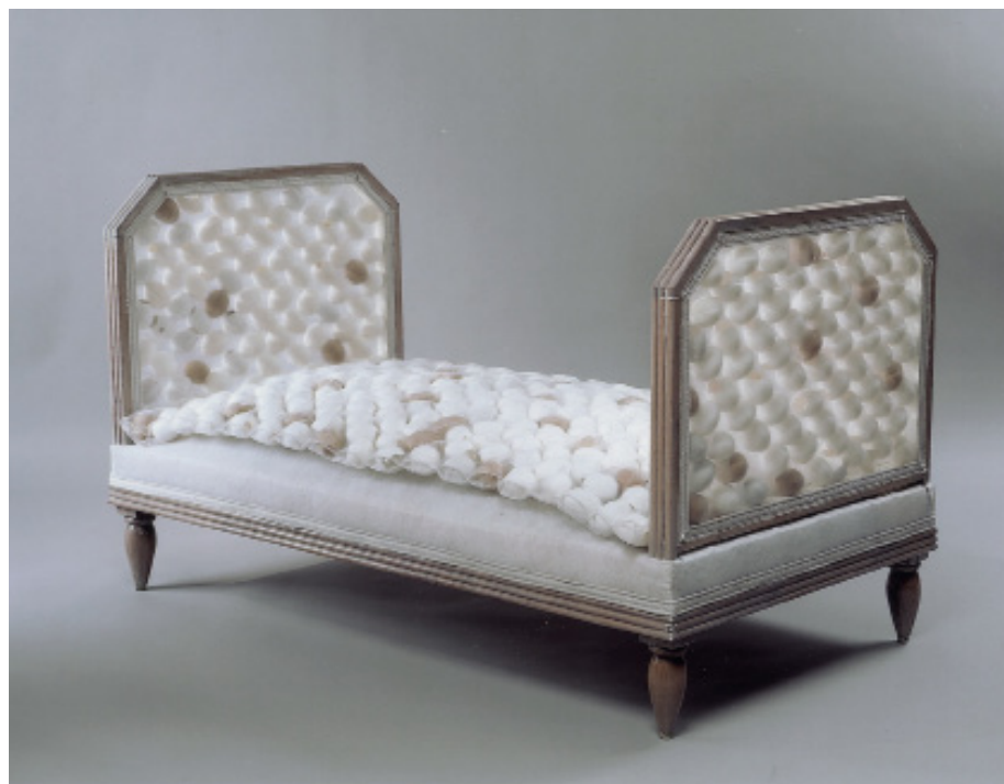
Divan d'artiste 1.20 x 0.80 x 0.80m, Bois, tissu, coquilles d'oeuf