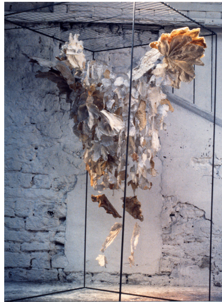
L'œuf ou la poule 1.50 x 1.50 x 3m, métal, papier, œuf

L'œuvre de Françoise Coutant nous entraîne dans son monde poétique, loin au-dessus des conventions, loin au-dessus du banal.