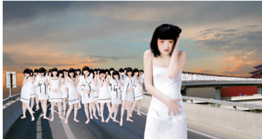
Angel 4 170X90.92 cm, 2006