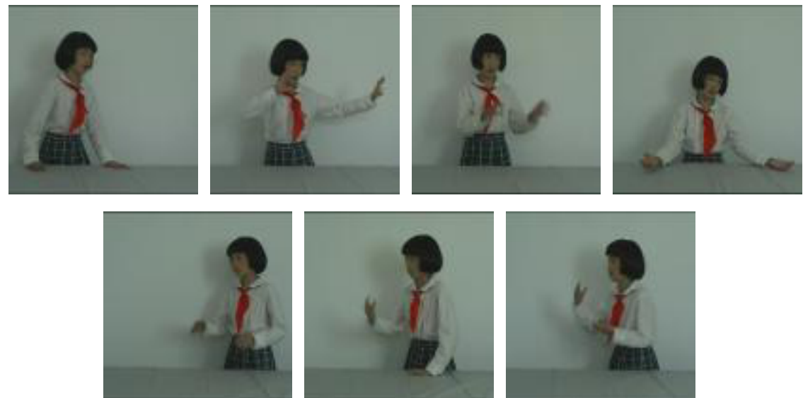
Sanjie installation vidéo, dimensions variables