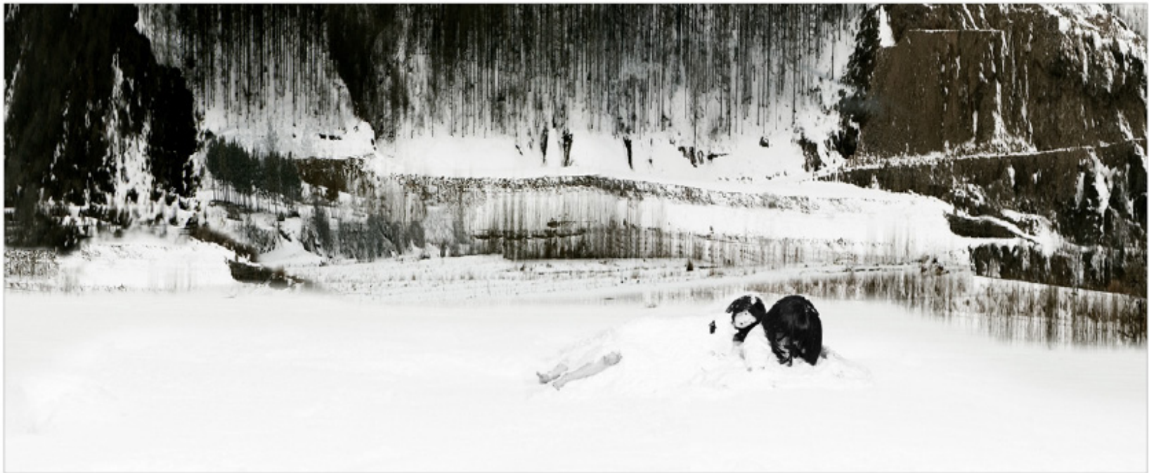
Existential Emptiness 5 130 x 57 cm, 2009