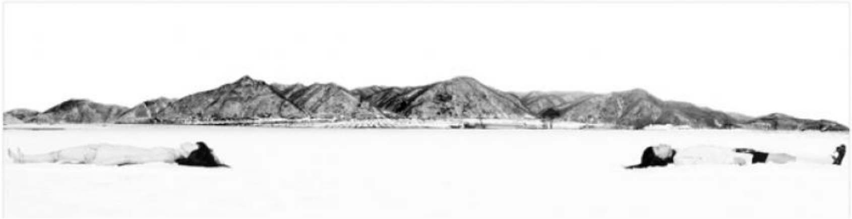
Existential Emptiness 1 243 x 67,5 cm, 2009