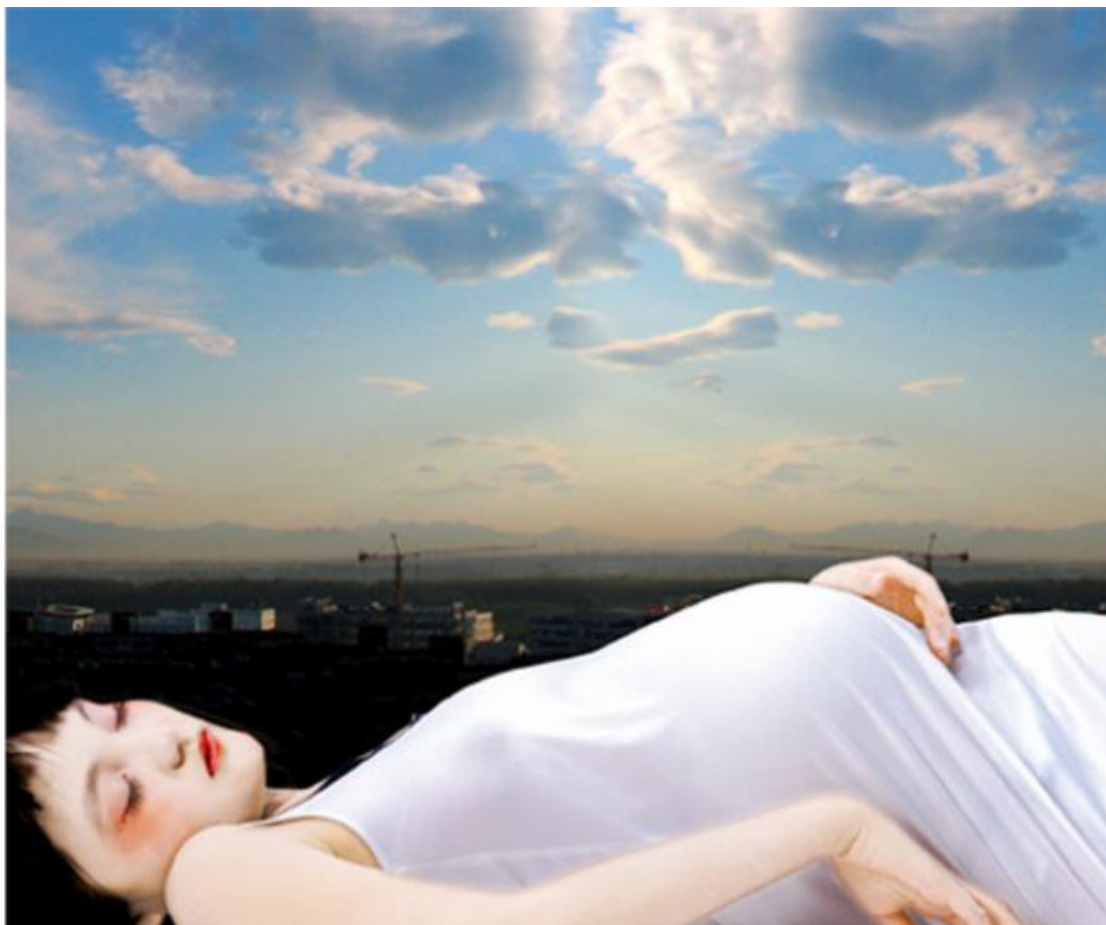
Angel No.13 80x66.67cm, 2006

La Galerie Dix9 a le plaisir de vous présenter