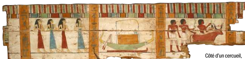
Côté d'un cercueil, XVIII e dynastie, vers 1550-1300 av. J.-C.