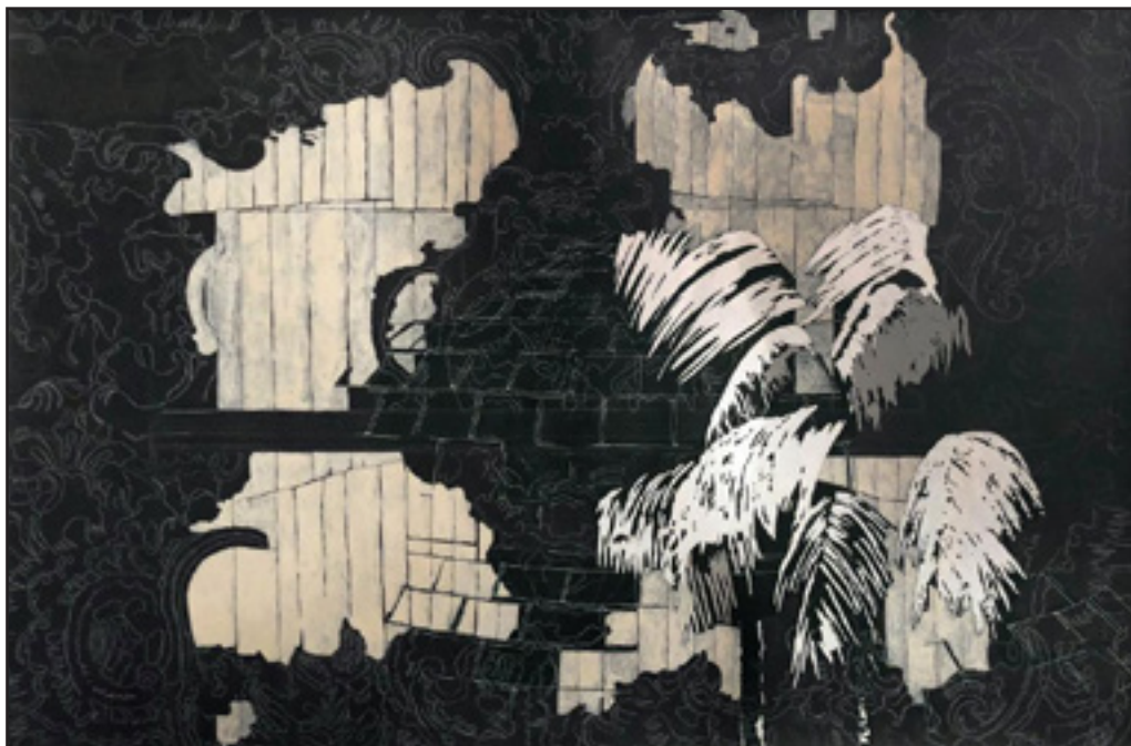
Firmamento (bare dome) , 2018 Acrylique, huile et encre sur toile, 86x130cm

Galerie Dix9 a le plaisir de vous présenter