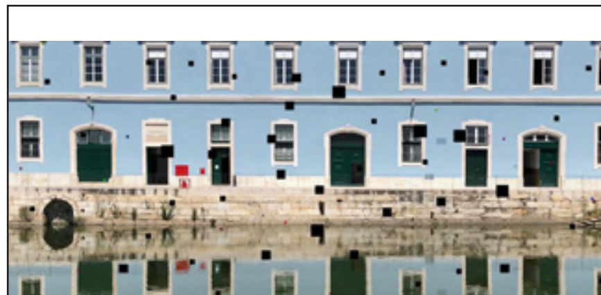
Firmamento , vidéo et animation, 2019, 6'